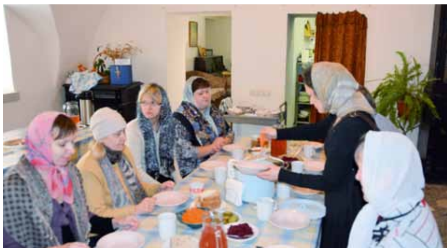
Обед в Клобуковом монастыре г. Кашина

да проводится чаепитие, а по праздникам и благотворительные обеды для наших посетителей. Отмечаются Дни Ангела каждого прихожанина и церковные праздники.