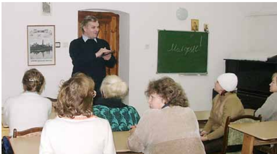
Занятия в воскресной школе, 2006 г.