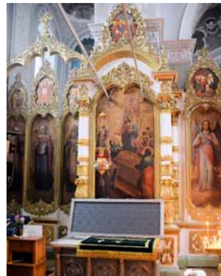
Паломничество к мощам бл. кн. Анны Кашинской

Мы продолжаем занятия, но реже, чем прежде, зато стали чаще собираться на богослужения, и это очень радует. После занятий в трапезной храма всег-