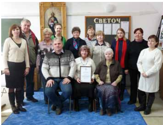
Инициативная группа с грамотой конкурса «Наше Подмосковье», 2014 г.