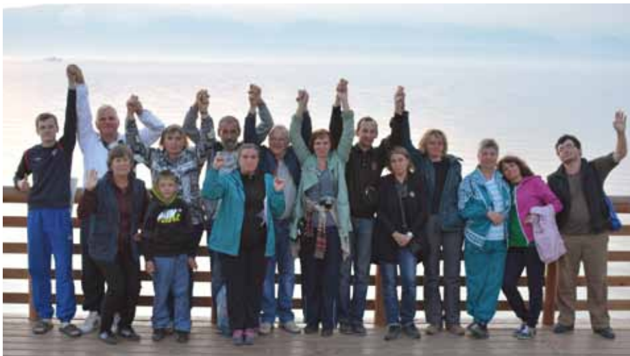
Община на Байкале, 2015 г.

Предоставляется возможность для реализации своих творческих способностей. Любой неслышащий может рассказать о своих увлечениях: занятиях вышивкой, фотографией, поделиться впечатлениями о прочитанной книге, о совершенном паломничестве, написать статью для журнала или газеты.