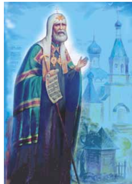
Миниатюра Свт. Тихон, худ. Якубовский

У нас часто совершались паломнические и познавательные поездки. Вначале совершались поездки: в Новодевичий монастырь, г. Москвы и храмы Московского Кремля, подмосковные Новоиерусалимский монастырь и Давидову Пустынь, Троицкий Александро-Невский монастырь в Клинском районе, Николо-Пешношский монастырь в Дмитровском районе, Нилова