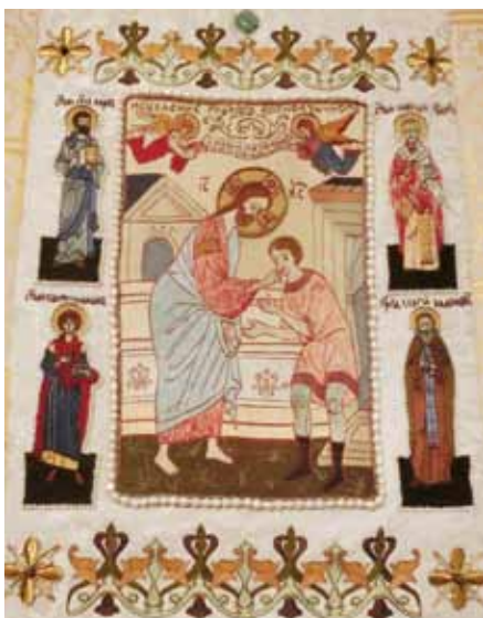
Икона «Исцеление глухого», вышитая мастерской «Яхонт»

Предоставляется возможность для реализации своих творческих способностей. Любой неслышащий может рассказать о своих увлечениях: занятиях вышивкой, фотографией, поделиться впечатлениями о прочитанной книге, о совершенном паломничестве, написать статью для журнала или газеты.