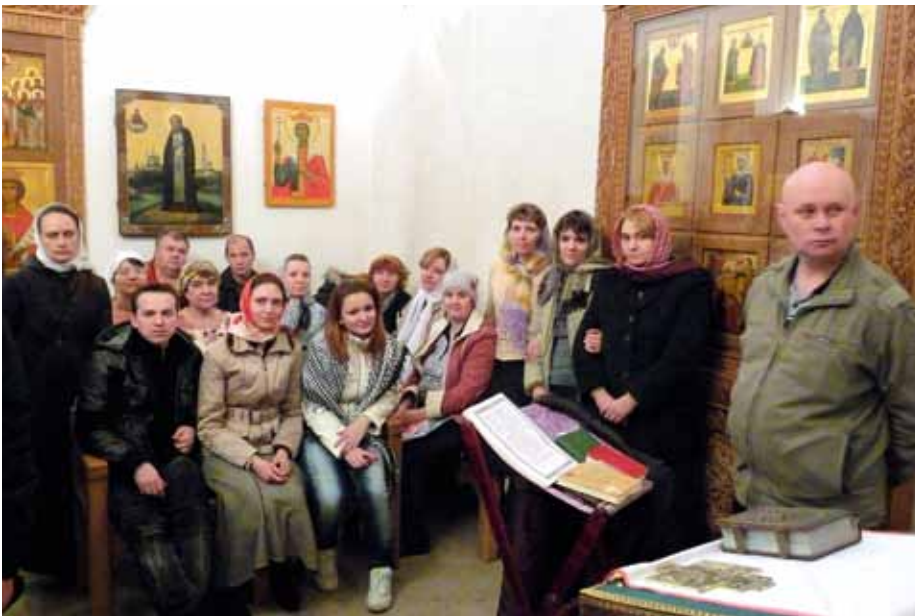
Неслышащие прихожане на Пасхальном богослужении. 2010 г.