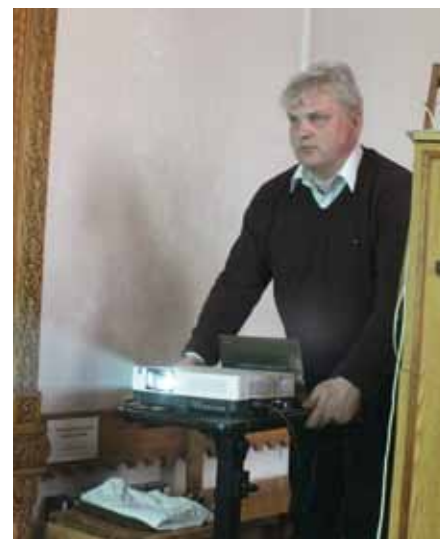
Балашов готовит технические средства

Впечатление от этого эксперимента у прихожан было позитивным. Никто из слышащих не жаловался на то, что экран отвлекает их во время службы, наоборот, им понравилось зрительное сопровождение службы. А неслышащие прихожане отметили, что встречаются со многими неизвестными словами и выражениями. Поэтому им были разъяснены значения слов и выражений. Основная цель эксперимента – ознакомление с содержанием православной пасхальной службы – была достигнута. Они не только поняли содержание службы, но и ощутили торжественность события, в честь которого проходила служба. Таким образом, презентация службы дала