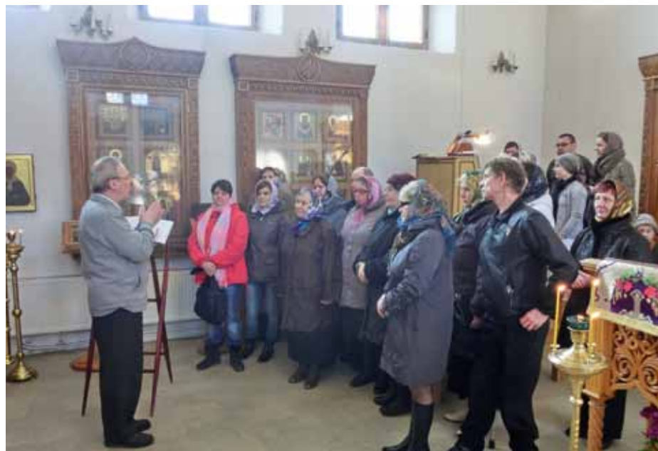
Перевод Божественной литургии на язык жестов

2. В храме, осуществляющем пастырско-миссионерскую деятельность, по мере возможности оборудовать придел с низким иконостасом (византийские алтарные преграды).