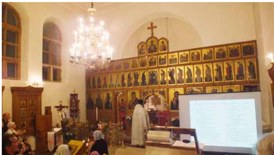
На Пасхальном Богослужении

«У нас все тайные молитвы священника читаются вслух, рассказывает настоятель, – Царские Врата открыты, на солее стоит большой экран, где параллельно можно следить по славянскому и русскому тексту. Также я поставил сбоку телевизор, на котором видно, что совер-