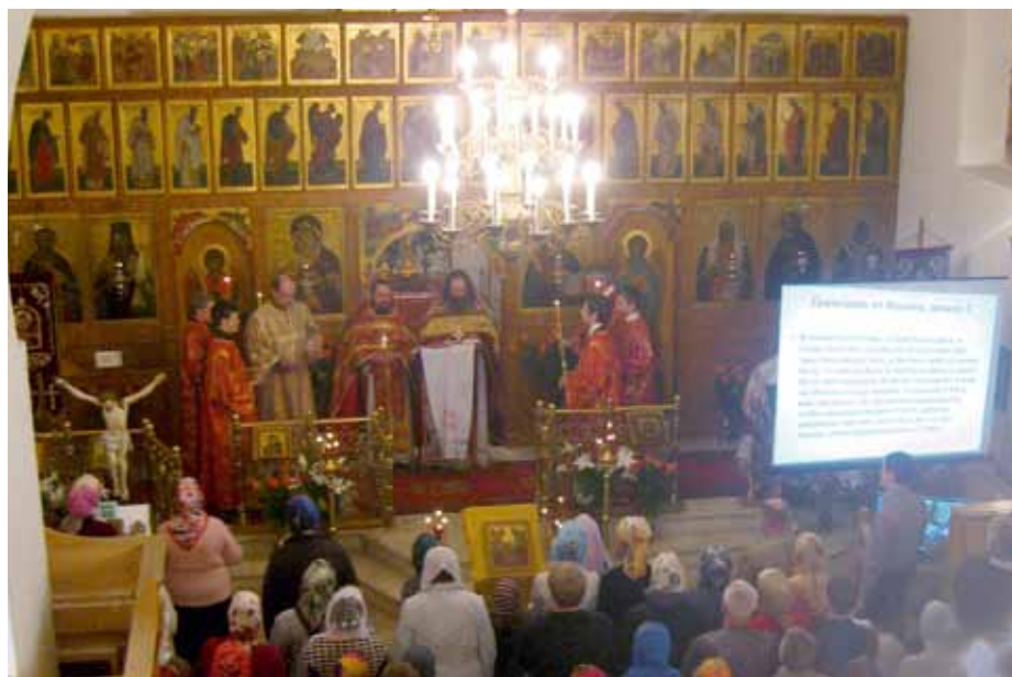
Чтение Евангелия на Пасху

Интересно, что этот случай исцеления был приведен только в Евангелии Марка, притом он был описан очень подробно. Описаны даже видимые действия и реплики Иисуса Христа. Для того, чтобы запомнить этот случай в подробностях и пронести через годы, нужен особый случай или потрясение, круто изменившее жизнь очевидца чудес Иисуса Христа. Если иметь в виду, что Евангелие от Марка было записано под руководством апостола Петра и является самым кратким и сжатым, этот случай исцеления глухого косноязычного так запомнился Марку, что он изложил все это в подробностях. Возможно, апостол Марк был тем самым глухим косноязычным, которого