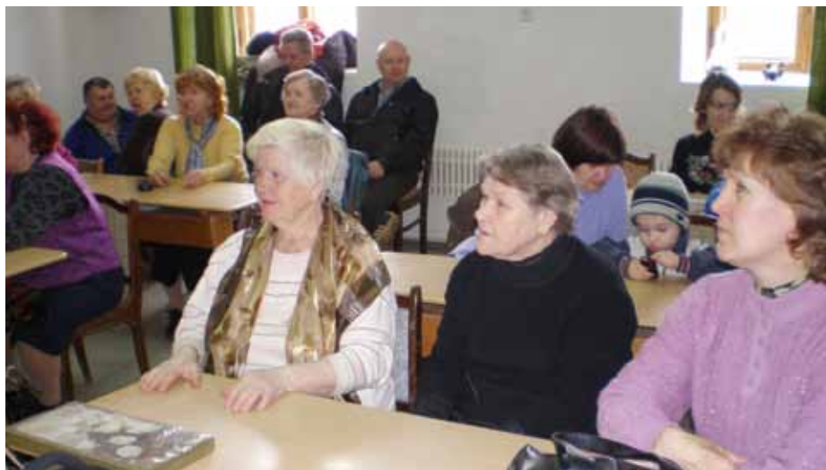
Курс занятий «Культура Православия»

вания – педагогическое и богословское, владеющий жестовым языком – языком межличностного общения глухих, каждую субботу ведет занятия по основам православной культуры для всех желающих. Благодаря его урокам глухие