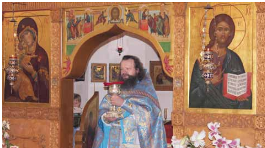
Тело Христово примимите!

В рамках учебы в аспирантуре я готовил статью для публикации, в которой я изложил взгляды по вопросам деятельности с лицами с нарушениями слуха. После некоторых раздумий я решил направить мою статью Святейшему патриарху Кириллу. В Патриархии решили, что всем этим должен заняться Преосвященный Пантелеимон, епископ Орехово-Зуевский, председатель Синодального отдела по церковной благотворительности и социальному служению. Последующие обращения на имя Патриарха из ВОГ только закрепили за ним эти функции. Отрадно, что деятельность в этом отделе развивается и все больше епархий вовлечены в это дело».