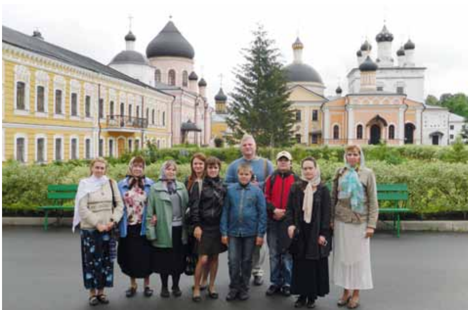
Давидова пустынь, 2010 г.

http://www.gluxix.net/deafnews/sobitiya/4186-2013-04-03-18-35-02