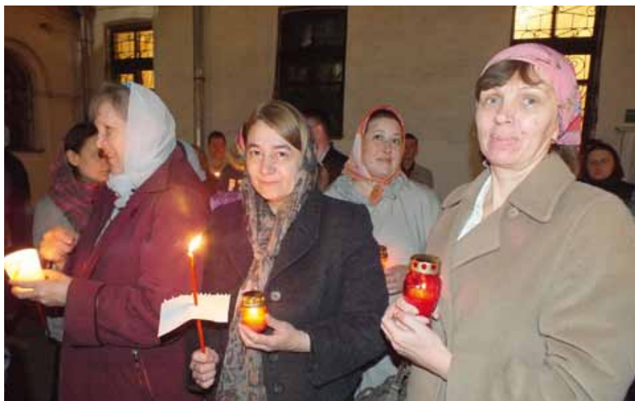
Крестный ход на Пасху

В храме экран был установлен ближе к клиросу, слайды были продемонстрированы согласно ходу службы и с помощью слышащих, знающих православные службы.