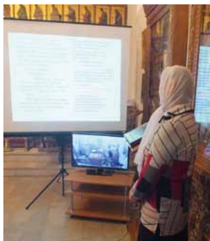
Текст службы на экране и трансляция из алтаря

исцелил Иисус Христос. Однако нужно иметь в виду, что апостол Марк в Евангелии себя не называет по имени, поэтому, благодаря церковному преданию, мы можем идентифицировать апостола Марка, называющего себя