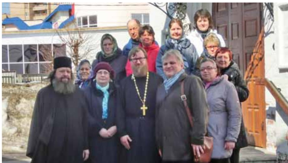
Тверская община глухих в гостях у клинчан, 2013 г.

Православная миссия, обращенная к глухим, не может быть отделена от социального служения, поскольку инвалиды по слуху особо нуждаются в христианском милосердии и заботе, помощи в социальной интеграции и реабилитации». («Рекомендации по организации