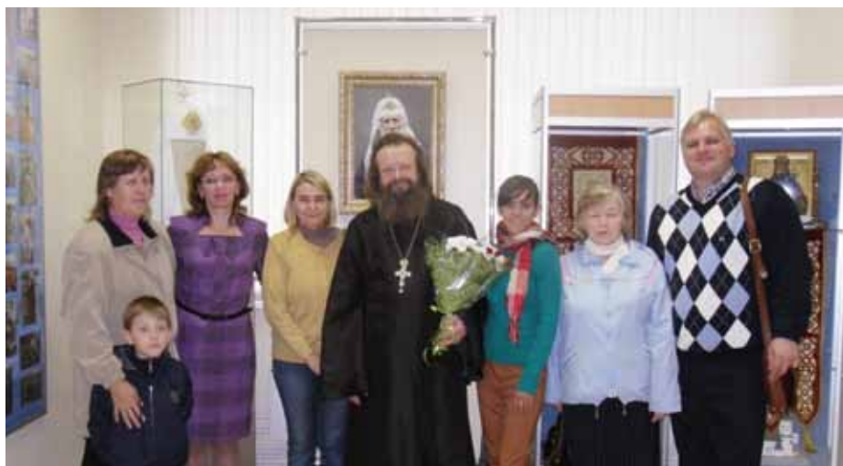
На выставке «Клин Православный», 2012 г.

«На следующий год наши неслышащие прихожане стали заниматься уже по программе Закона Божия. То, есть наступил наиболее ответственный момент. Люди потихоньку и с нашей помощью становятся церковными. Но это процесс происходил довольно про-