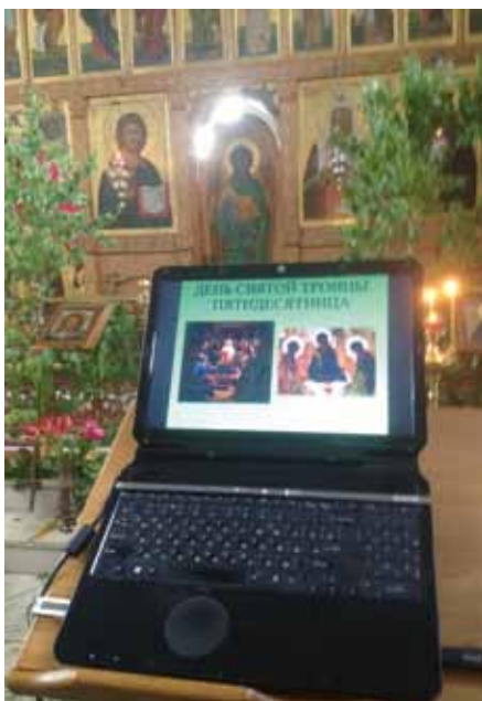
Текст службы. День Святой Троицы