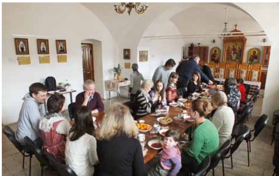
За трапезой после богослужения

Уже несколько лет подряд, в начале каждого учебного года в сентябре неслышащие слушатели уже сами изъявляют желание продолжить занятия в воскресной школе. С ними уже можно проводить занятия по программе Закона Божия и изучению Нового Завета. Кроме того, программу можно было составлять с учетом пожеланий слушателей воскресной школы (История Православия родного края, местночтимые святые, православная кухня, цер-