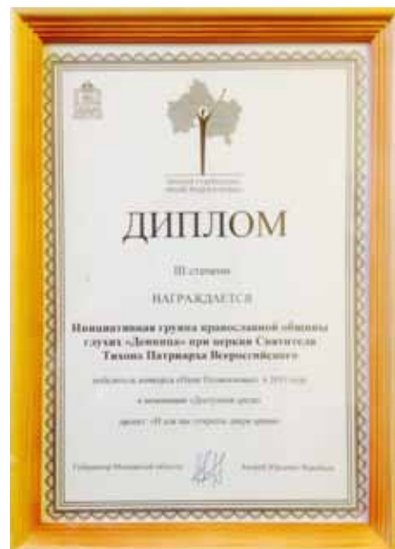
Диплом победителя конкурса «Наше Подмосковье»

При организации богослужения неслышащим необходимо создавать благоприятные условия для зрительного