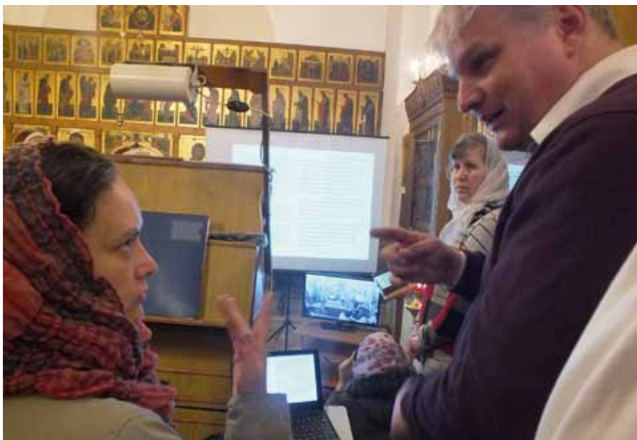
В храме отведено место для трансляции

неслышащим толчок к их умственному и нравственному развитию.